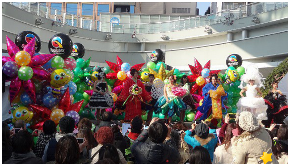
一番の盛り上がりを見せたファッションドレス部門のステージ