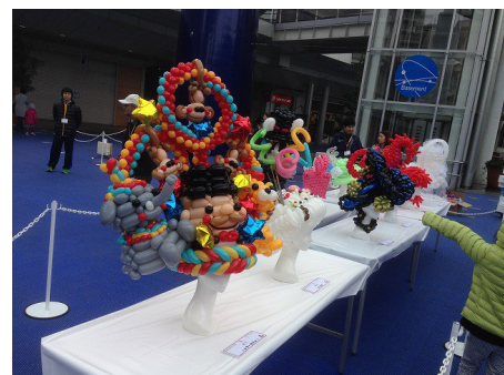
会場にコンペティション作品の全てが並び、見る人を楽しませていました