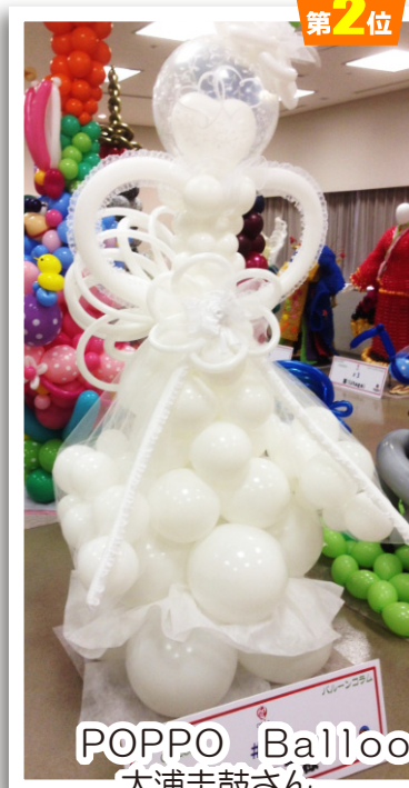
POPPO Balloon 大浦圭鼓さん