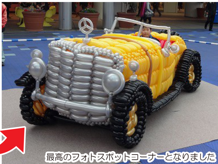
最高のフォトスポットコーナーとなりました