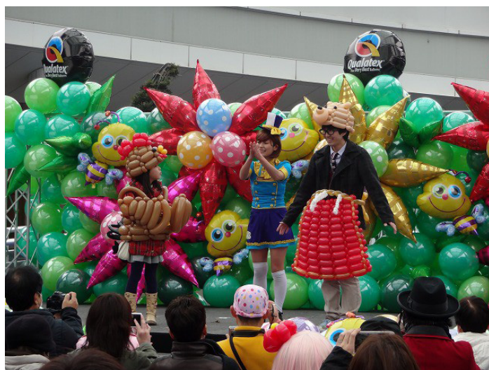
華やかに繰り上げられる様々なステージパフォーマンス