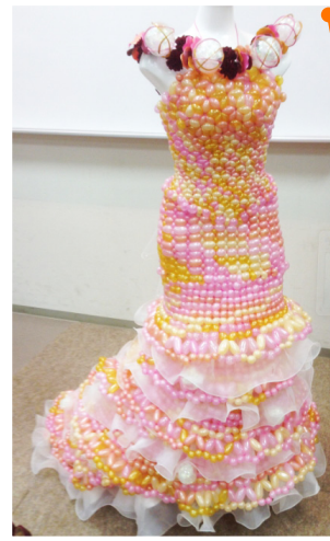
Balloon Milk 長田妃沙子さん