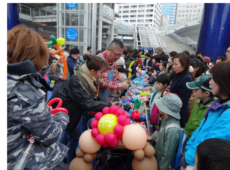
トップクラスのバルーンパフォーマー達がバルーンフィギュアをその場で作成。会場は大賑わいを見せる。QBAC だから出来る特別なバルーンワールド。

凄腕のデコレーターが 一同に作り上げたバルーンカーの オブジェはなんと乗ることが可能！